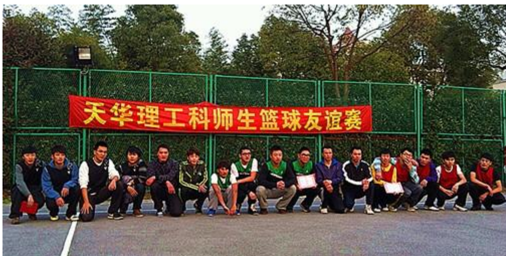
(工科系师生篮球赛，增强学院工科师生之间的友谊)

学院实行学生党员结对责任制和班助理制度、拥有学生党员、班助理、院系学生会等多种形式的学生自治管理队伍，在老师的悉心指导下有序的深入学生群体内开展工作，学生党员通过一帮二的结对形式，班助理通过配合新生辅导员管理班级早晚自习，学生会通过配合院系团组织开展活动等多管齐下的方式在学院的学生管理中发挥着不可取代的积极作用，也成为了师生间相互增加沟通了解的有效途径。从而使得师生间建立起了深厚的情感，师生关系，生生关系均非常和谐，从侧面促进了校园健康向上的良好氛围形成。