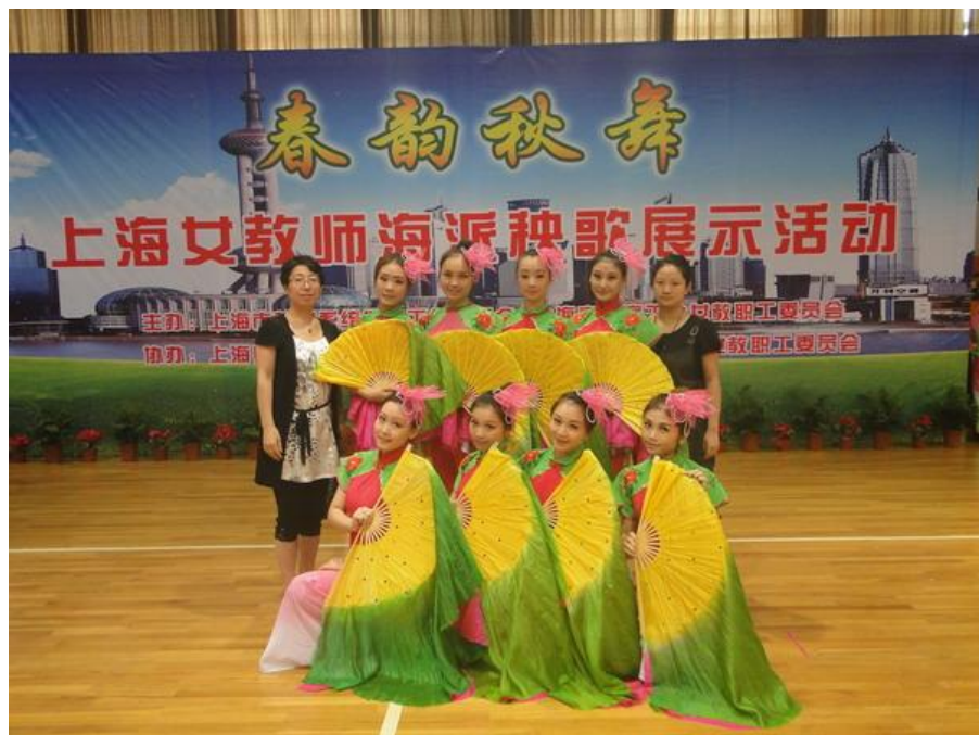
(女教师参加市教育工会举办的“春韵秋舞——上海女教师海派秧歌展示活动”，荣获“最佳表演奖”)

召开教职工趣味运动会，加强各部门职工之间的交流，提高教职工体育健身的自觉性和主动性，形成“健康工作，幸福生活”的良好风气。为丰富住校教师的业余