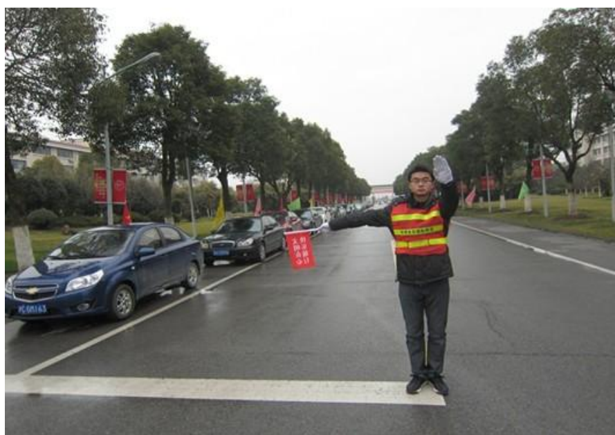
(学生交通协管员指挥校园交通)

随着学院师生人数的逐渐增多，校园交通安全问题日益凸现，为此学院行政处专门对校园交通设施和标识进行了更新，保卫处制定并完善了校园交通安全