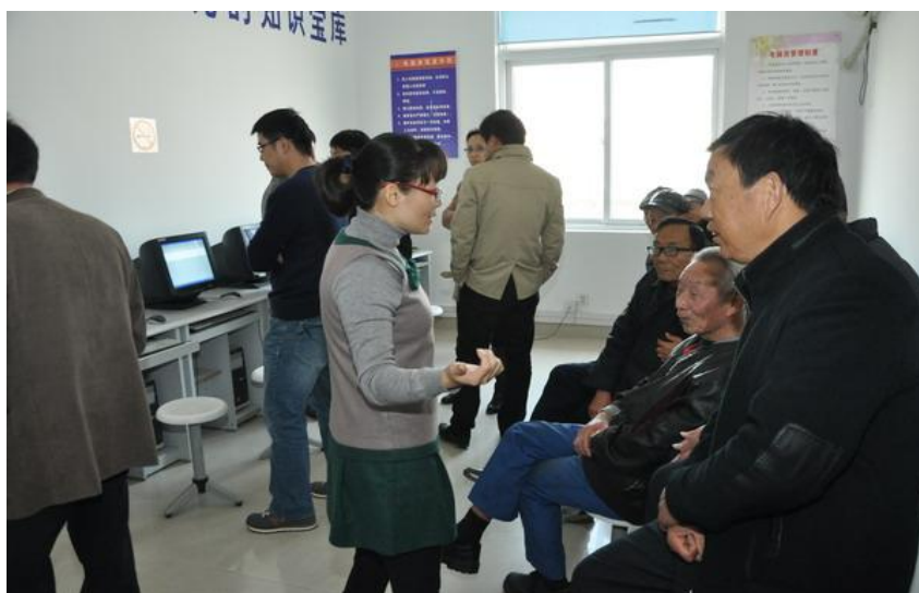
(行政三支部党员开展科技服务社区活动)

务工作提出了新的要求，希望通过与我院携手党建工作，我院通过大学生社会实践、公益活动的平台，为泾河村发展注入新的活力。