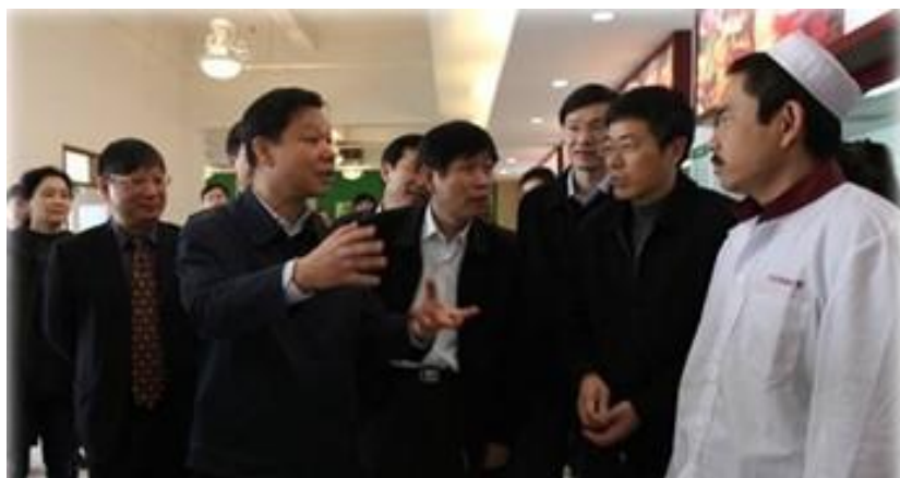
（副市长姜平视察我院新疆班培训）

2012年3月28日，市政府姜平副市长来校调研新疆大学生就业培训工作，姜平一行先后走进新疆大学生双语课教室、琴房、画室，与师生们亲切交谈，了解他们来沪以来的学习情况。随后，姜平