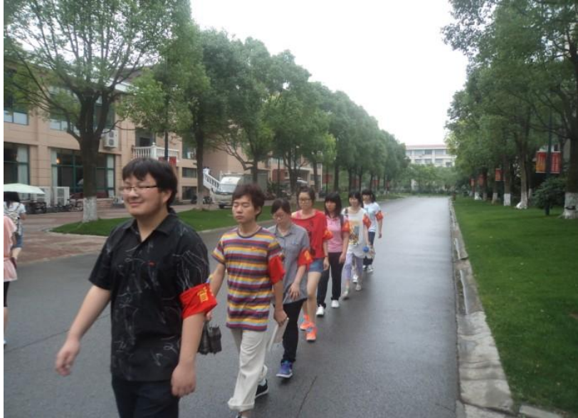
(天华学院校园控烟监督队)

并专门成立了一支校园控烟监督队，加强校园巡查，在教学楼、办公楼等楼宇显著位置张贴禁烟标识，办公室、