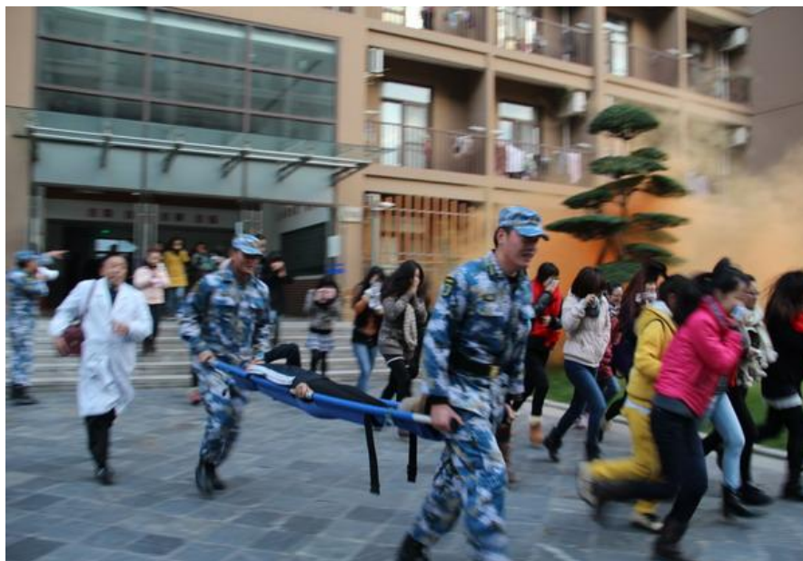
(高层学生宿舍楼消防逃生演练)

练。2012年11月，学院保卫处在女生公寓7号楼开展了一场“高层宿舍楼火灾逃生演练”，整栋宿舍楼为11层，居住学生达2000多人，演练要求所有学生听到火灾警报后按照逃生动作快速撤离宿舍楼，到指定区域进行集中。为保证演练